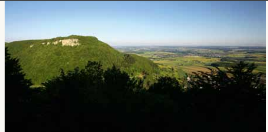
Das Lappertal unterhalb des Ostfelsens