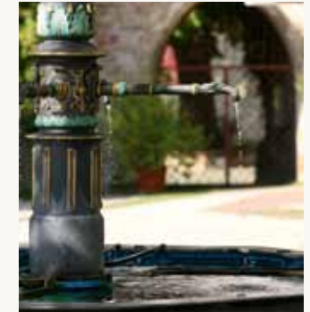
Brunnen am Marktplatz Heubach