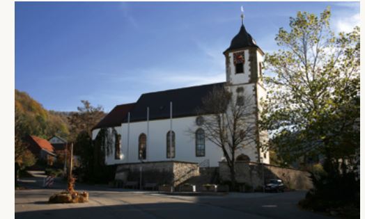
Die katholische Pfarrkirche in Lautern steht an der engsten Stelle des Tales