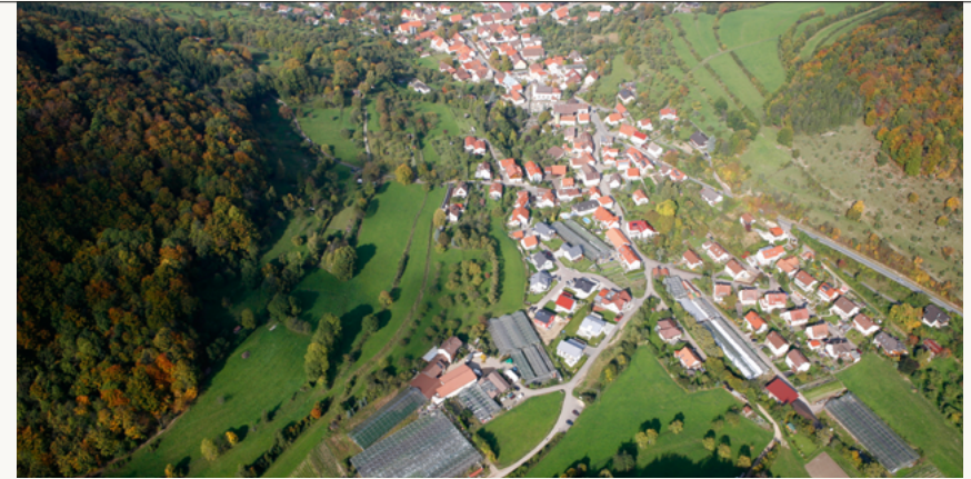
Das Gärtnerdorf Lautern aus der Vogelperspektive