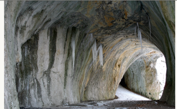
Die Große Scheuer (44m lang) am Nordhang des Rosensteins

Stellung » Herrgotts-Brünnlein » Franz-Keller-Strasse » Richtung Schützenhaus Bärenhalde » rechts ab über Lempp-Weg (bequemer Weg) zum Schlossweg » Wegspinne » Finsteres Loch » Ostfelsen » Höhle Grosse Scheuer » Höhle Haus » Panoramaweg am Albtrauf » Schöne Aussicht » Waldschenke » Lärmfelsen » Ruine Rosenstein » Franz-Keller-Weg » Stellung