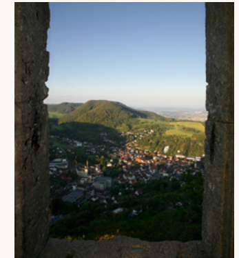
Blick von der Burgruine Rosenstein auf Heubach