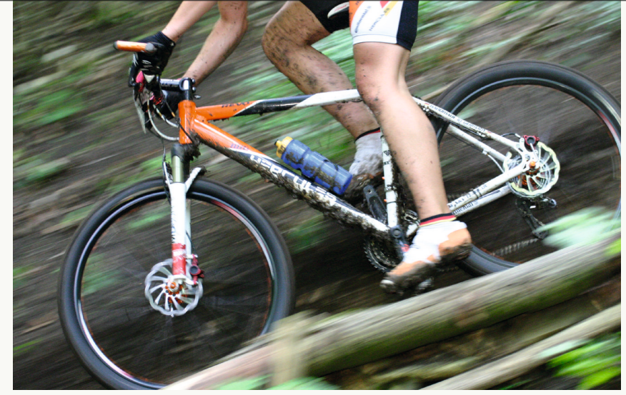
Anspruchsvolle Strecke nur für geübte Fahrer geeignet