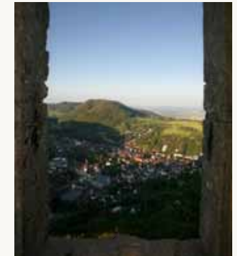
Blick von der Burgruine Rosenstein auf Heubach