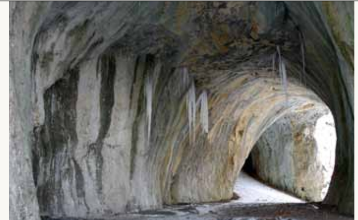
Die Große Scheuer (44m lang) am Nord- hang des Rosensteins