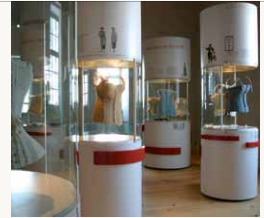
Niedermuseum im Schloss