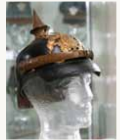
Polizeimuseum, welches im Polizeiposten untergebracht ist

INFO → leicht ↳ Länge: 7,3 km ≡ Höhenmeter: 253 hm Nicht für Kinderwagen geeignet.